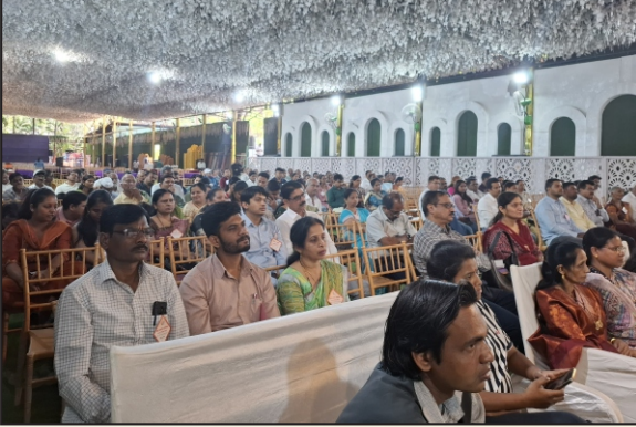
वधू-वर मेळाव्यास पालक आणि वधू-वर मोठ्या संख्येने उपस्थित होते.