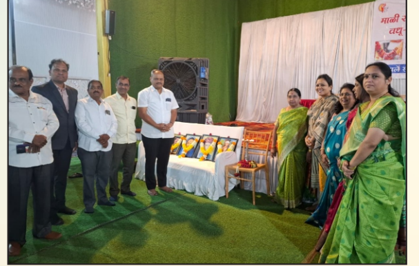
वधू-वर मेळाव्यास उपस्थित मान्यवर.