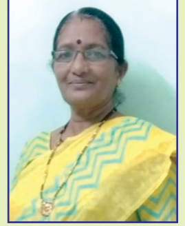
कल्पना करपे १८ एप्रिल