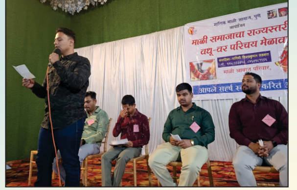
वधू-वर परिचय करून देताना.